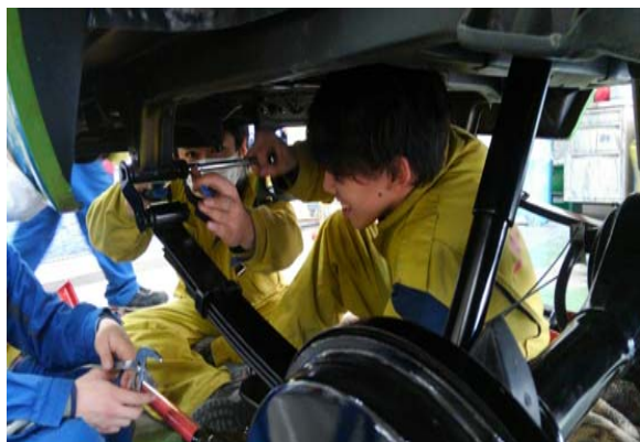
ホーシング、リーフスプリングの組み付け。