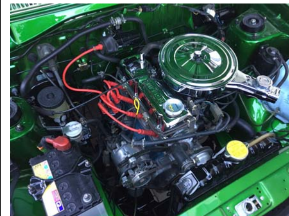
すべて組みつけて完成。