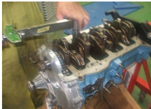
エンジンオーバーホール時のトルク管理もしっかりと。