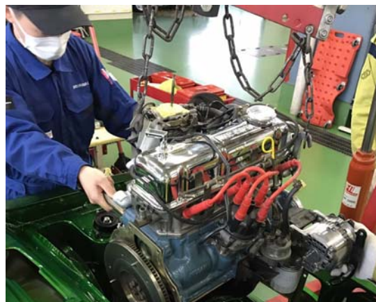
エンジン、ボディに傷を付けない様に組み付け。