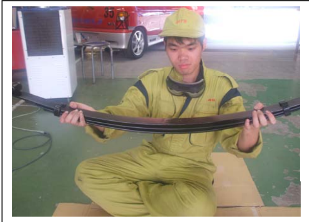
リーフスプリングも一枚ずつにして塗装。