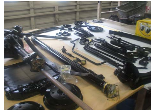
小物部品も黒で塗装。