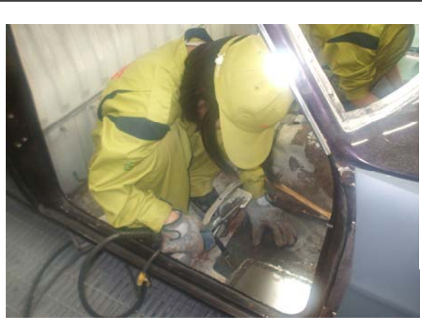
鋼板で作り直して溶接。