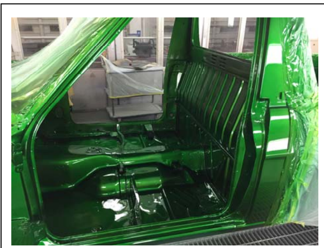
整形後ボディと同じくキャンディ塗装。