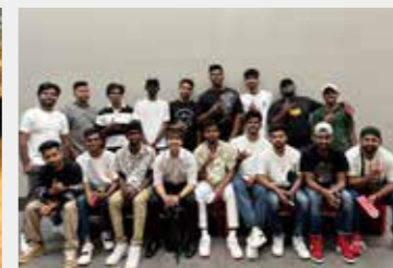
東京オートサロン